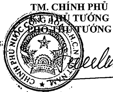
Lê Minh Khái